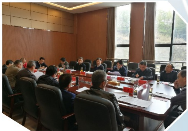
4月10日，市政协召开《关于加强新时代全市政协党的建设工作的实施意见》稿征求意见座谈会。