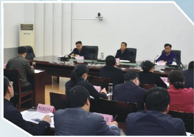
4月12日，市委书记刘雪荣主持召开座谈会，对领衔督办的重点提案《关于加快大别山革命老区振兴发展规划有效实施的几点建议》进行督办。