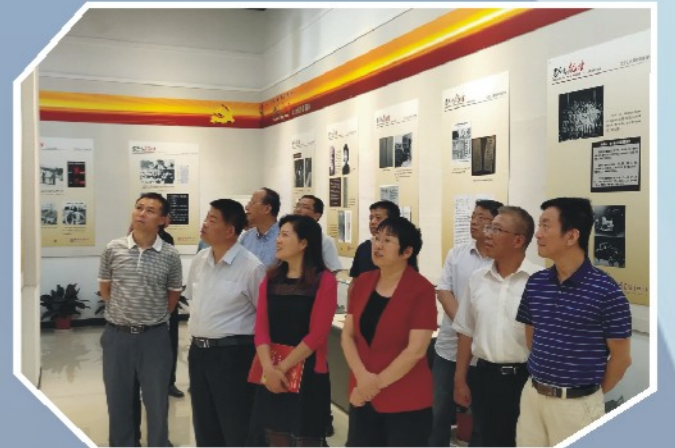
5月28日，市政协组织机关干部观看廉政警示教育片和《监察法》“党史中的纪律”专题展。