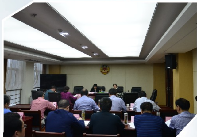
5月13日，市政协党组书记、主席洪再林主持召开重点提案工作推进会。