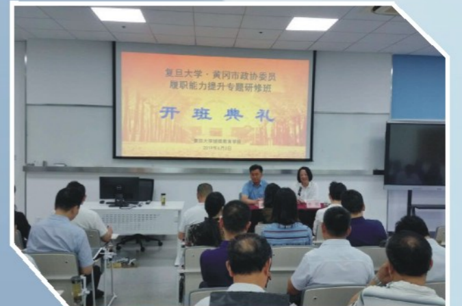
6月3日-7日，黄冈市政协委员履职能力提升专题研修班在复旦大学举行。