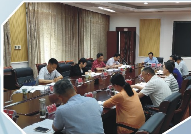
5月30日，市政协在红安召开“协商在一线”试点工作座谈会。