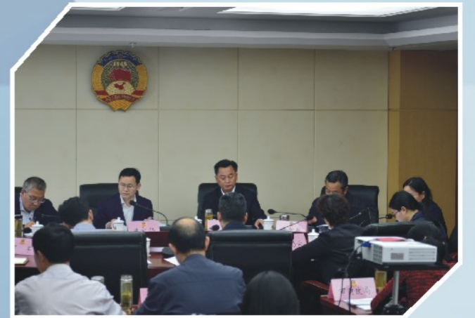
4月23日，市政协召开“创建国家公共文化服务体系示范区，助推‘双强双兴’战略实施”双月协商座谈会。