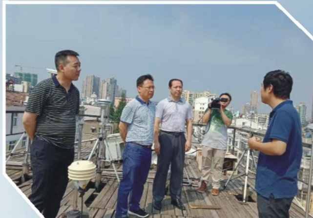
6月24日至25日，省政协办公厅和省广播电视台联合主办的《提案追踪》电视栏目组来我市开展电视专访。