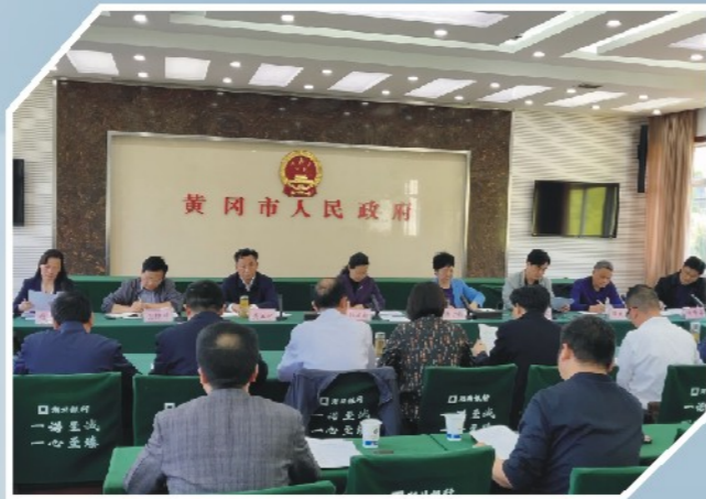
4月17日，市委副书记、市长邱丽新主持召开政协重点提案办理工作专题会。