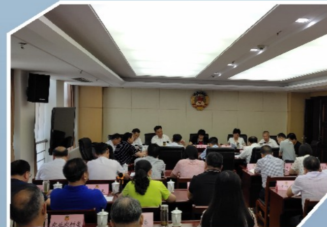
6月26日，市政协召开“完善基层健康服务体系，助推健康黄冈建设”双月协商座谈会。