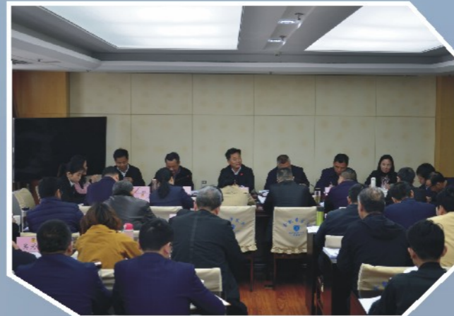
4月11日，全市政协文史和社情民意信息工作座谈会。